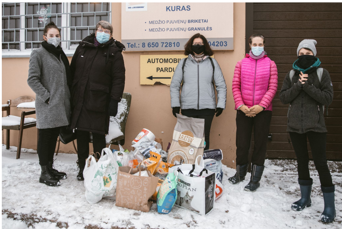
„Senvagės“ gimnazija. Mokinių išvyka į Tautmilės gyvūnų prieglaudą.

Vilniaus „Senvagės“ gimnazijos projekto pabaigoje mokiniai kartu su mokytojais vežė surinktas gėrybes į prieglaudą, vedžiojo gyvūnus, bendravo su prieglaudos darbuotojais-savanoriais.