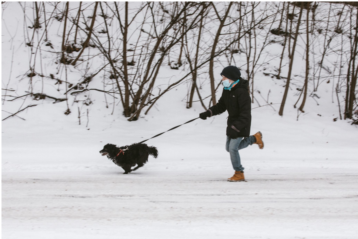
„Senvagės“ gimnazija. Mokinių išvyka į Tautmilės gyvūnų prieglaudą.